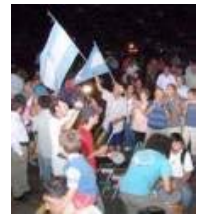
Asambleístas recibieron 2008 en Arroyo Verde, protestando contra Botnia.

Decenas de familias de Gualeguaychú recibieron el nuevo año en el campamento de la Asamblea Ciudadana Ambiental, en Arroyo Verde, desde donde mantienen su protesta contra la instalación de las plantas de pasta de celulosa desde hace más de un año. En el lugar hubo cena a la canasta, con parrilladas, fuegos artificiales y un brindis del que también participaron ambientalistas uruguayos que repudian a Botnia.